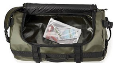
ÉTUI IMPERMÉABLE POUR ACCESSOIRES PEUT SE FIXER À DEUX ENDROITS

MÉTHODE DE MARQUAGE PAR DÉFAUT: SÉRIGRAPHIE: Montage: 80,00 $ (ci. 1 couleur/1 surface comprise).