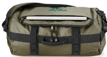
COMPARTIMENT EXTERNE RÉSISTANT À L'EAU POUR ORDINATEUR PORTABLE AVEC ACCÈS RAPIDE