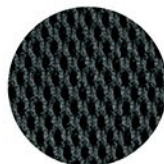
BRETELLES EN MATÉRIEL FILET