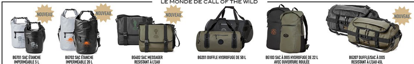
BG701 SAC ÉTANCHE IMPERMÉABLE 5 L